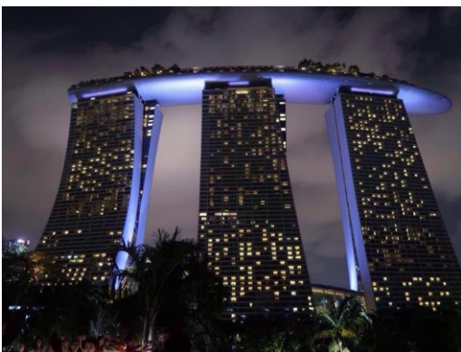
Kuva 1 Singaporen keskustassa sijaitseva Marina Bay Sands -hotelli

Suosittelen vaihtoon lähtemistä kaikille! Vaihdossa pystyy opiskelemaan siinä missä Suomessakin ja samalla tutustuu uusiin kavereihin ympäri maailmaa. Englannin kieli paranee jo puolen vuoden vaihdossakin, eikä yhden lukukauden vaihdossa ehdi edes tulla koti-ikävä.